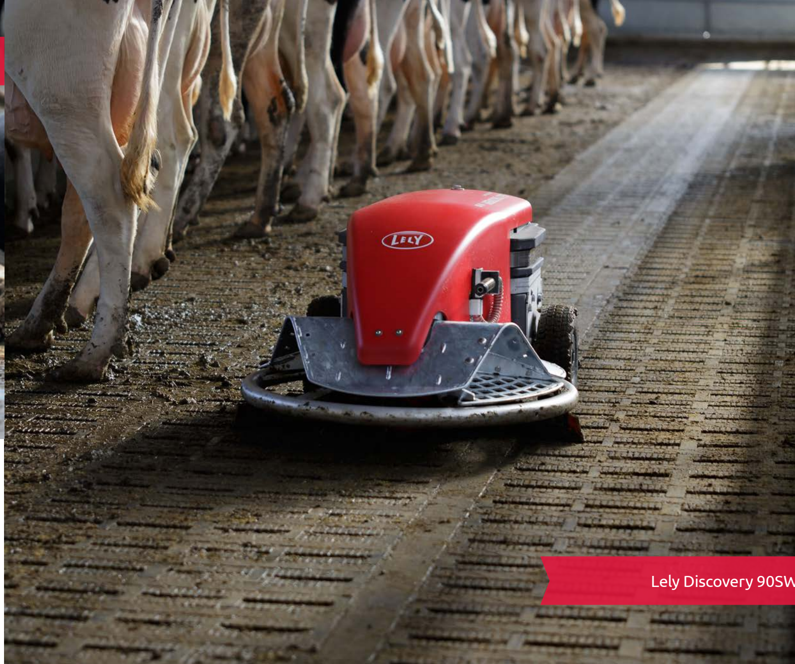
Lely Discovery 90SW