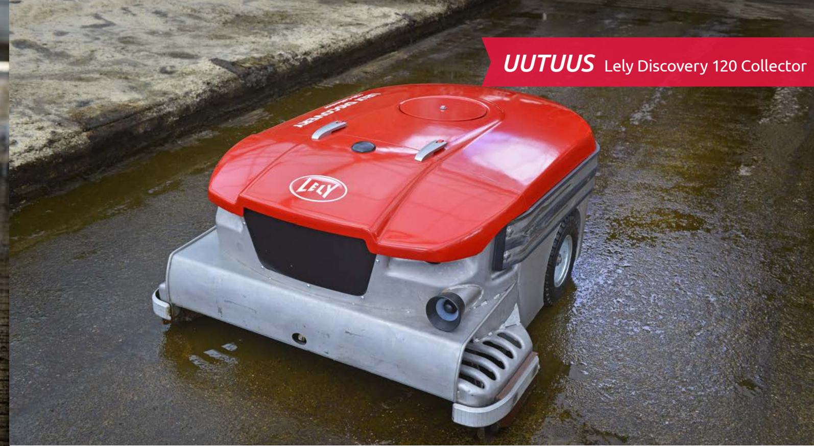
UUTUUS Lely Discovery 120 Collector